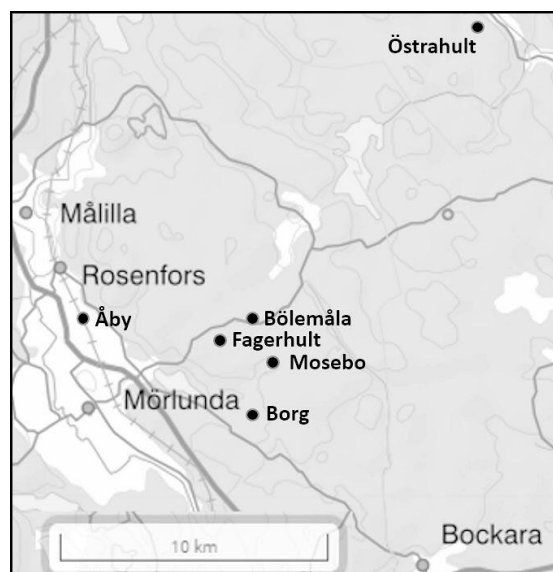
Figur 1 | Karta Mörlunda socken.