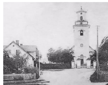
Figur 2 Mörlunda kyrka

Sven och Stina vigs i Mörlunda kyrka den 7 november 1830. Lysning har skett 12, 19 och 26 september.