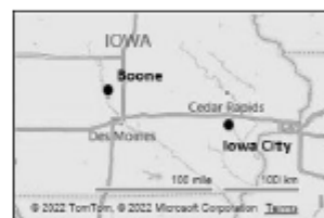
Figur 1 Karta Iowa. Källa Bing via FTM

En text och karta kompletterar bilden av personernas liv.