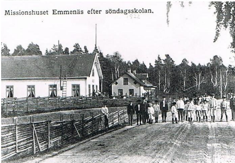
Missionshuset Emmenäs efter söndagsskolan.