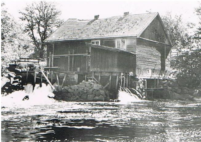
År 1743 Byggs Kvarn & mjölnare -bostad. (Kvarnstugan)